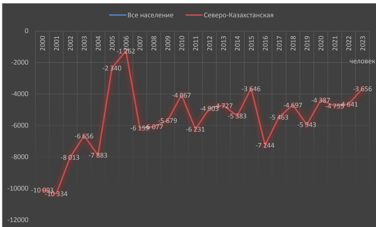
Рисунок - 2 Сальдо общей миграции Северо-Казахстанской области [1]