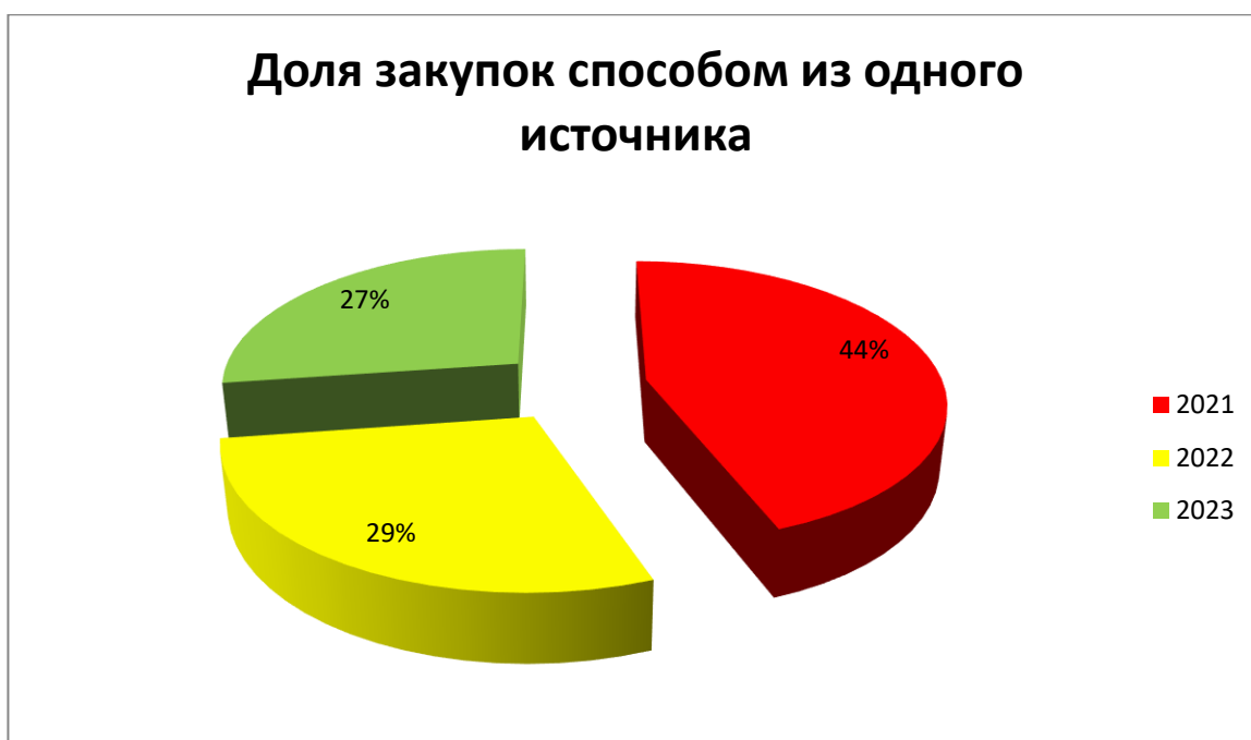
1 -Рисунок – Доля государственных закупок заключенным способом из одного источника

Так, согласно предоставленному ответу от Министерства финансов по запросу журнала inbusiness.kz., в прошедшем, 2023 году четверть всех государственных закупок произведена способом из одного источника. В процентном соотношении рассмотрим в диаграмме долю государственных закупок, которые были заключены способом из одного источника за три года в процентном соотношении [3].